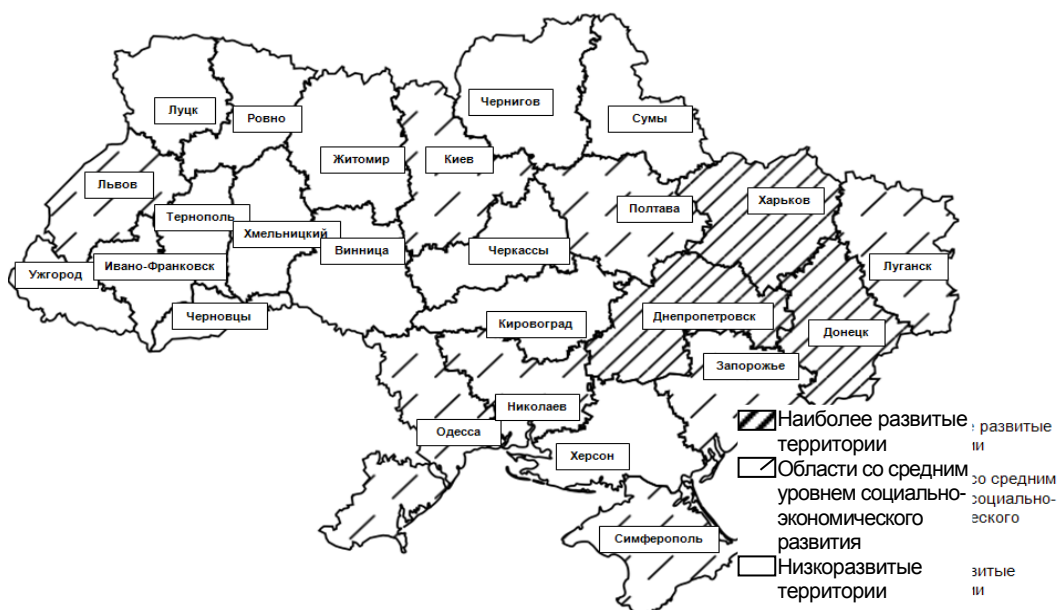
Рис. 1. Социально-экономическое развитие регионов Украины за 2012 год

Для начала можно рассмотреть кластерную характеристику регионов Украины по уровню социально-экономического развития за 2012 год, представленную на рис. 1 [4].