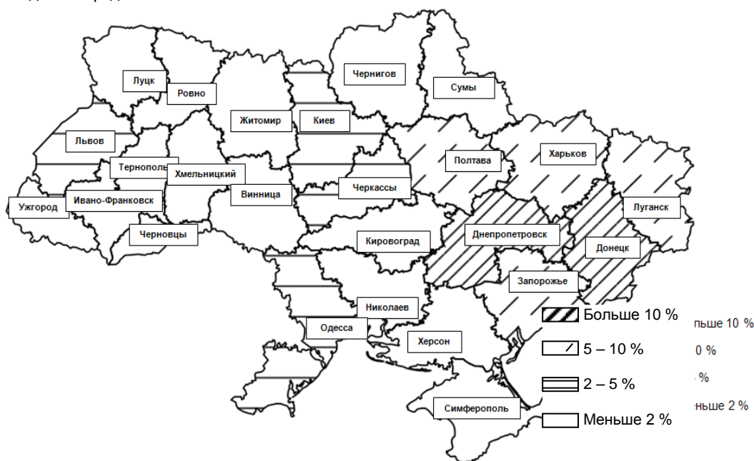
Рис. 3. Центры роста на 2012 год

Следует рассмотреть на карте наиболее развитые промышленно территории, уже существующие "центры роста" (рис. 3). Косой штриховкой выделены те области, где объем реализованной промышленной продукции превышает 10%, пунктиром – те, в которых объем реализованной промышленной превышает 5%, горизонтальной штриховкой отмечены те области, где объем изучаемого показателя превышает 2%. Все остальные не заштрихованные области находятся в пределах ниже 2%.