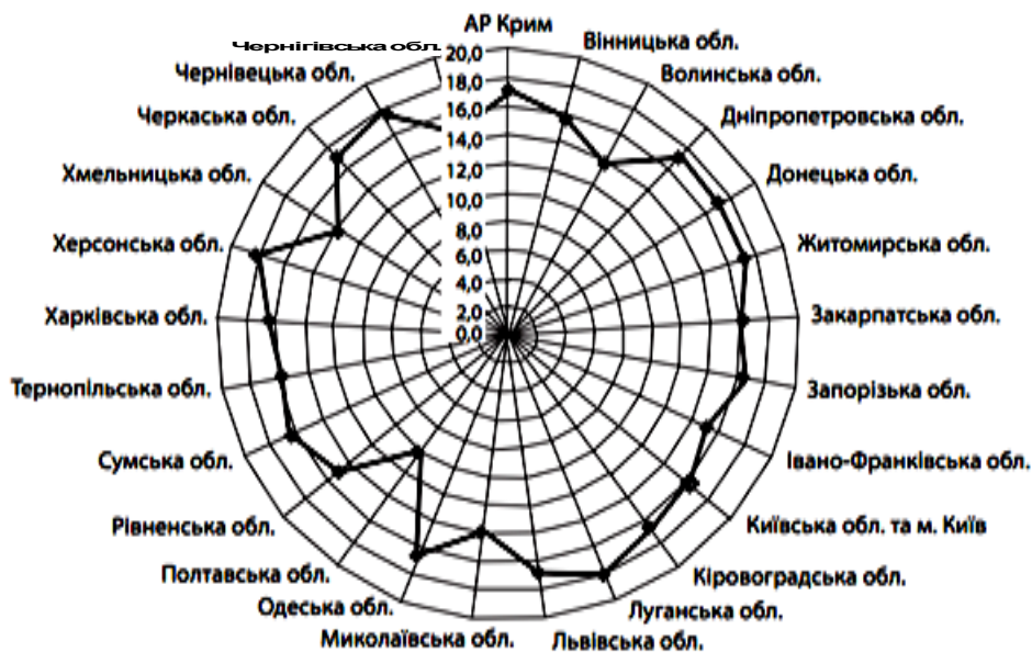
Рис. 2. Середньозважені ставки за іпотечними кредитами по областях України за 2012 р.

Також про нерівномірність розвитку ринку іпотечного кредитування свідчить і нерівність середньозважених процентних ставок за позиками, які на кінець 2012 р. коливались від 10,1 до 18,1 % при середньому по Україні рівні 16,1 % (рис. 2) [2].