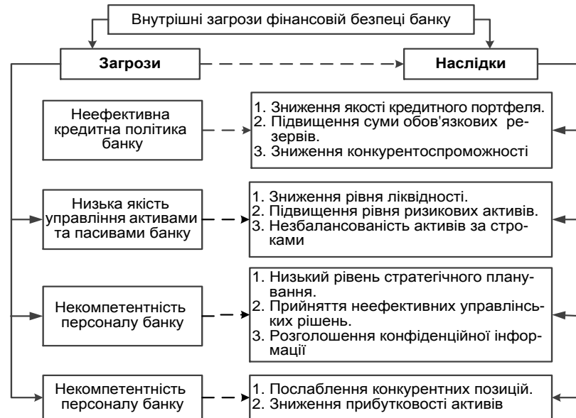
Рис. 3. Внутрішні загрози фінансовій безпеці банку

Своєчасне виявлення внутрішніх та зовнішніх загроз викликає необхідність створення дієвої системи управління фінансовою безпекою банку, метою функціонування якої, на думку автора, є збільшення маси отриманого прибутку, прискорення оборотності капіталу, зростання курсової вартості цінних паперів банку.