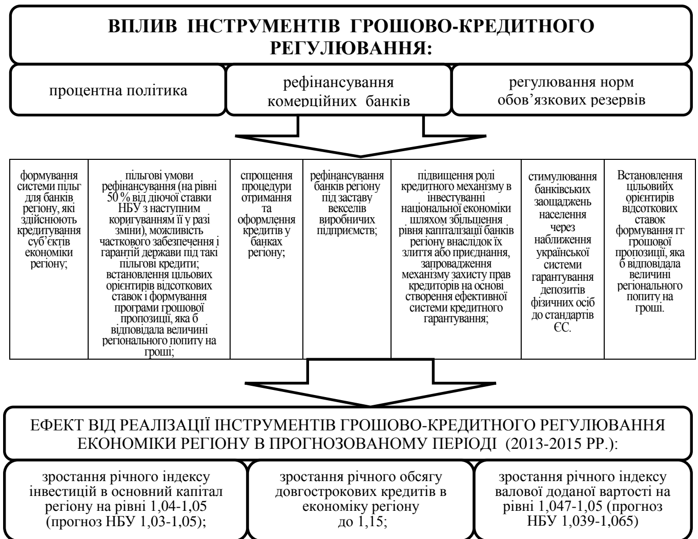
Рис. 5. Регулювання економіки регіону інструментами грошово-кредитної політики

Оскільки розроблене теоретичне та методичне забезпечення використання інструментів грошово-кредитної політики є взаємопов'язаним і становить єдине ціле, у дисертації воно об'єднано у запропонований механізм, основні складові якого представлено на рис. 5.