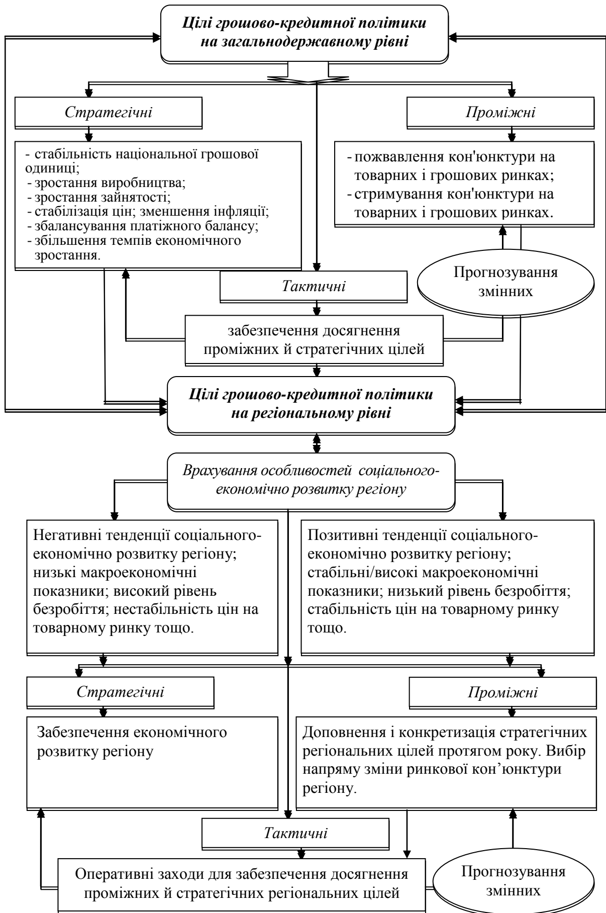
Рис. 1. Групування цілей грошово-кредитної політики щодо регулювання економіки держави та регіону