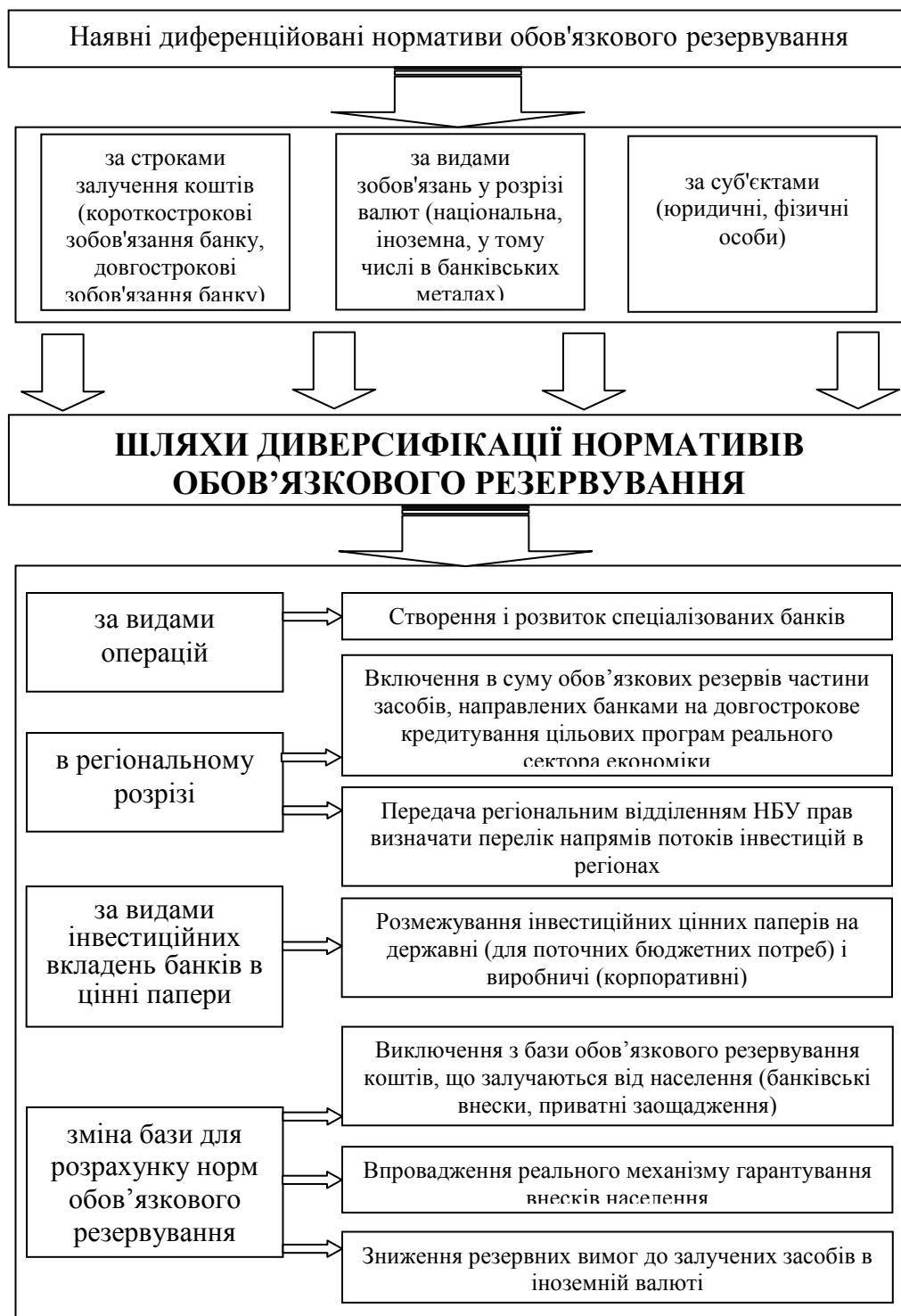
Рис. 4. Заходи з диверсифікації нормативів обов'язкового резервування залежно від характеру операцій, що проводяться банками

Отримані на основі модельних розрахунків прогностичні оцінки темпів росту ВДВ знаходяться в розрахованому НБУ інтервалі (табл. 3), що свідчить про ефективність вирішення завдання забезпечення розвитку економіки регіону за допомогою комплексу таких інструментів грошово-кредитної політики як рефінансування банків регіону, процентні ставки за операціями НБУ, нормативи обов'язкових резервів та про практичну значущість обґрунтованої та розробленої моделі.