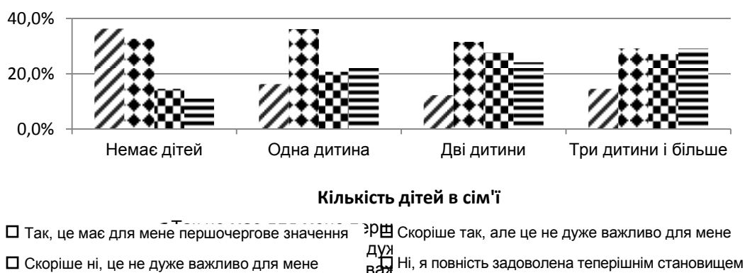
Рис. 2. Розподіл відповідей респондентів із різною кількістю дітей стосовно нереалізованих кар'єрних прагнень щодо більшої професійної реалізації, % відповідної сукупності респондентів ("Чи має для Вас професійна реалізація першочергове значення?")

становищем, була найнижчою. Оскільки цю групу утворюють переважно молоді респонденти віком 20 – 28 років, це підтверджує поступову трансформацію моделі матримоніальної і дітородної поведінки, за якої молодь намагається спочатку здійснити певні кроки у професійній реалізації, а потім приступати до генеративної діяльності (рис. 2).