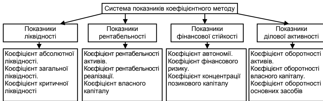
Рис. 1. Система показників оцінки фінансового стану підприємства відповідно до коефіцієнтного методу

Комплексний метод дає змогу виявити ті напрями в діяльності підприємства, в яких виникають проблеми, а також досліджувати причини, що їх зумовили. Це є величезною перевагою даного методу. Комплексна оцінка фінансового стану підприємства проводиться за допомогою розрахунку показників, що наведено на рис. 2.