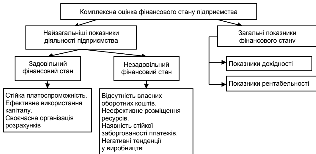
Рис. 2. Показники комплексної оцінки фінансового стану підприємства

Комплексний метод дає змогу виявити ті напрями в діяльності підприємства, в яких виникають проблеми, а також досліджувати причини, що їх зумовили. Це є величезною перевагою даного методу. Комплексна оцінка фінансового стану підприємства проводиться за допомогою розрахунку показників, що наведено на рис. 2.