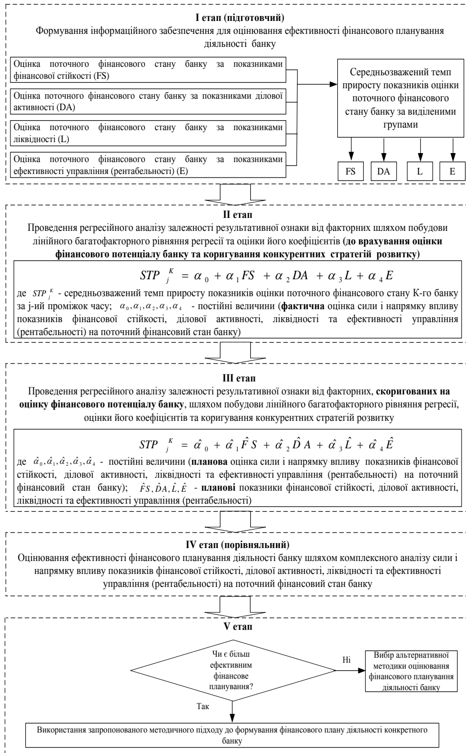
Рис. 2. Алгоритм реалізації методичного підходу до оцінювання ефективності фінансового планування діяльності банку

Результати застосування методичного підходу до оцінювання ефективності фінансового планування діяльності банку свідчать про невідповідність поточних показників оцінки поточного фінансового стану банку потенційно можливим.