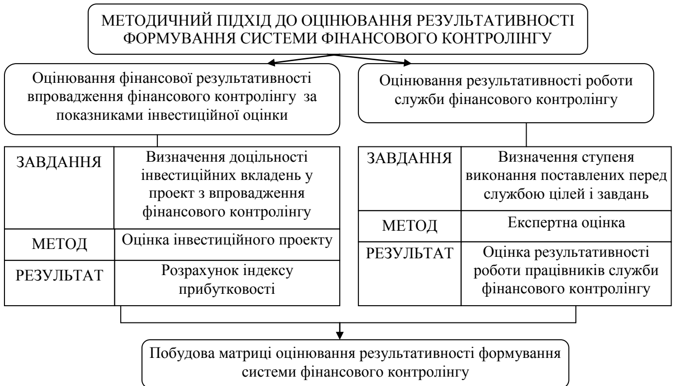
Рис. 4. Методичний підхід до оцінювання результативності формування системи фінансового контролінгу банківської діяльності

У дисертації розроблено методичний підхід до оцінювання результативності формування системи фінансового контролінгу банківської діяльності (рис. 4).