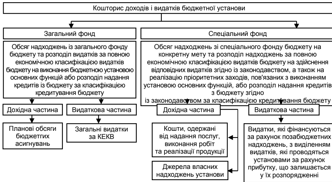
Рис. 2. Економічний зміст кошторису доходів і видатків бюджетної установи [7]

Щоб з'ясувати сутність контролю формування і виконання кошторису, слід проаналізувати, яке місце займає зазначене питання в перевірці діяльності бюджетної установи. Під час перевірки діяльності бюджетної установи органами Державної контрольно-ревізійної служби одним із основних питань є контроль за формуванням та виконанням кошторису. Саме контроль питання достовірності формування кошторису є першочерговим, оскільки він дає змогу зробити висновок, чи мало місце зайве виділення асигнувань або недофінансування установи. Контроль (від франц. controle – перевірка) тлумачать як: 1) складову управління економічними об'єктами та процесами, що полягає у спостереженні за об'єктом з метою перевірки відповідності його стану, що спостерігається, бажаному чи необхідному стану, передбаченому законами, положеннями, інструкціями, іншими нормативними актами, а також програмами, планами, договорами, проектами, угодами; 2) контроль над об'єктом, реальну владу, зосередження прав управління об'єктом в одних руках [8]. Можна дати авторське визначення контролю – це функція управління, яка полягає у виявленні, запобіганні та попередженні порушень суб'єктами контролю з метою забезпечення ефективної діяльності суб'єкта господарювання. Дане трактування окреслює його місце в управлінні, визначає мету здійснення контролюючих заходів.