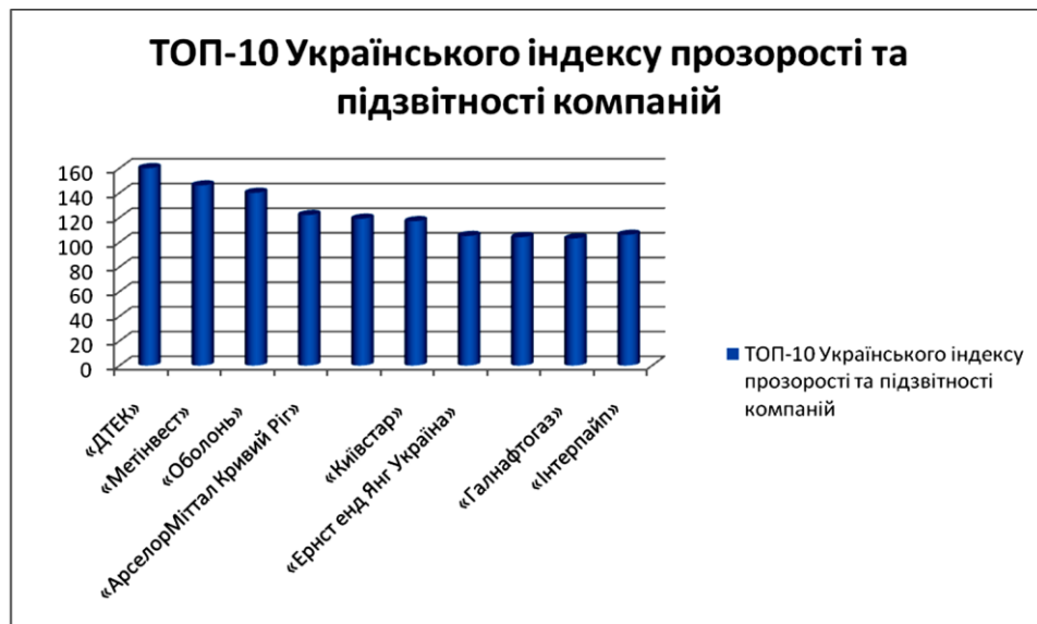
Рис. 1. ТОП-10 компаній українського індексу прозорості та підзвітності компаній

Тема оцінки ефективності компаній у сфері корпоративної соціальної відповідальності сьогодні є питанням, яке потребує додаткового вивчення. У вересні 2011 року центр "Розвиток корпоративної соціальної відповідальності" презентував результати першого в Україні Індексу прозорості та підзвітності компаній [1]. До Індексу увійшли компанії України різних секторів, саме тому можна було оцінити загальний стан КСВ та її висвітлення в Україні (рис. 1).