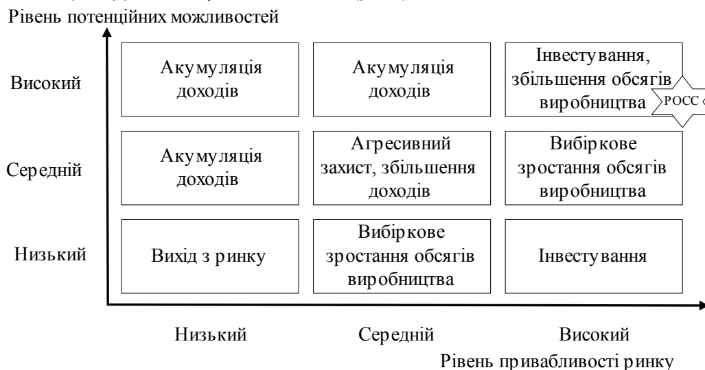
Рис. 3. Матриця визначення стратегічних позицій розвитку економічного потенціалу підприємства "Діловий екран"

Для реалізації стратегії ВАТ "РОСС" та визначення напрямків його діяльності було проаналізовано стан та перспективи розвитку конкурентних переваг за допомогою матриці визначення стратегічних позицій підприємства "Діловий екран" фірм McKinsey та General Electric (рис. 3).