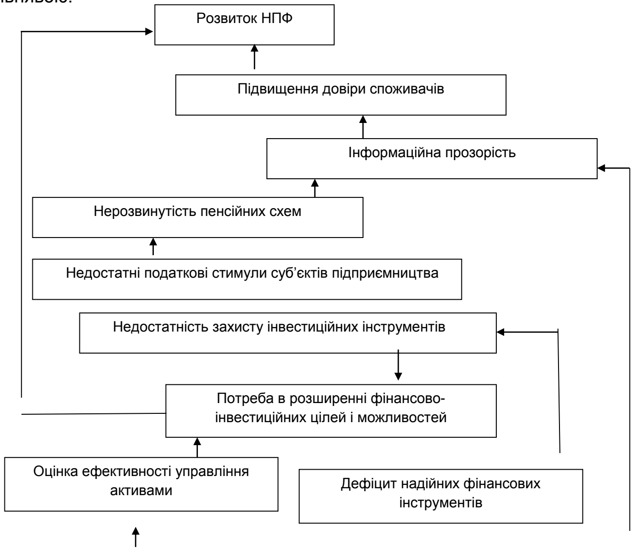
Рис. 2. Ієрархія впливу факторів напряму фінансової стратегії недержавного пенсійного фонду суб'єктів підприємництва

Побудована ієрархія факторів напряму фінансової стратегії недержавного пенсійного фонду суб'єктів підприємництва є восьми рівнявою.